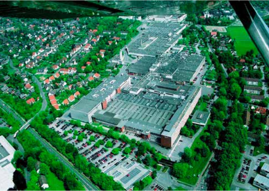
Gebäude Mohn Media GmbH in Gütersloh

Die Fa. Mohn Media GmbH in Gütersloh liefert aus ihrer Produktion ausgekoppelte Wärme zur Gasvorwärmung der Stadtwerke Gütersloh.