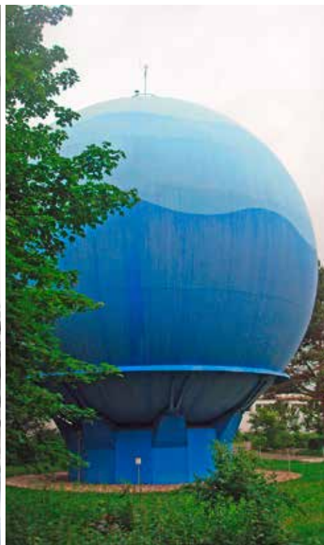
Die Gaskugel der Stadtwerke Gütersloh