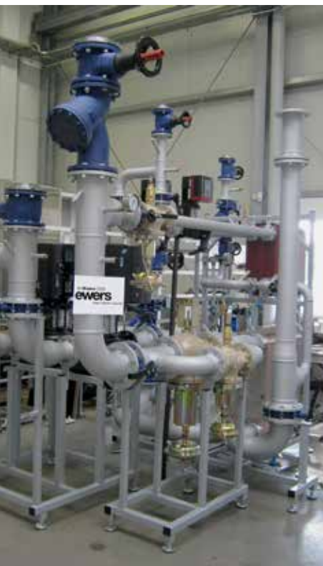
Die ewers Anlage — Modularer Aufbau 3 MW bestehend aus Volllastmodul 2,5 MW und Teillastmodul 0,5 MW

Bei Fragen wenden Sie sich jederzeit gerne an uns.