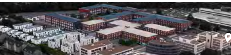
Das Lenkwerk Quartier