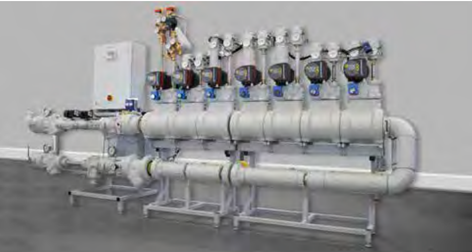
Die ewers Station für die Fernwärmeübergabe

Das Lenkwerk ist ein altes Firmengelände im Stadtbezirk Bielefeld Mitte, damals als Luftwaffenbekleidungsamt bekannt. In den vergangenen Jahre wurden rund um das Lenkwerk Quartier mehrere bekannte Architekturbauten wie das Lenkwerk Plaza und jetzt neu das Lenkwerk No.1 errichtet. Heutzutage befinden sich auf dem Lenkwerk Quartier, z. B. das bekannte Oldtimer-Museum, Werkstätten für klassische Automobile sowie Büros, Wohnungen, Gastronomie und vieles mehr.