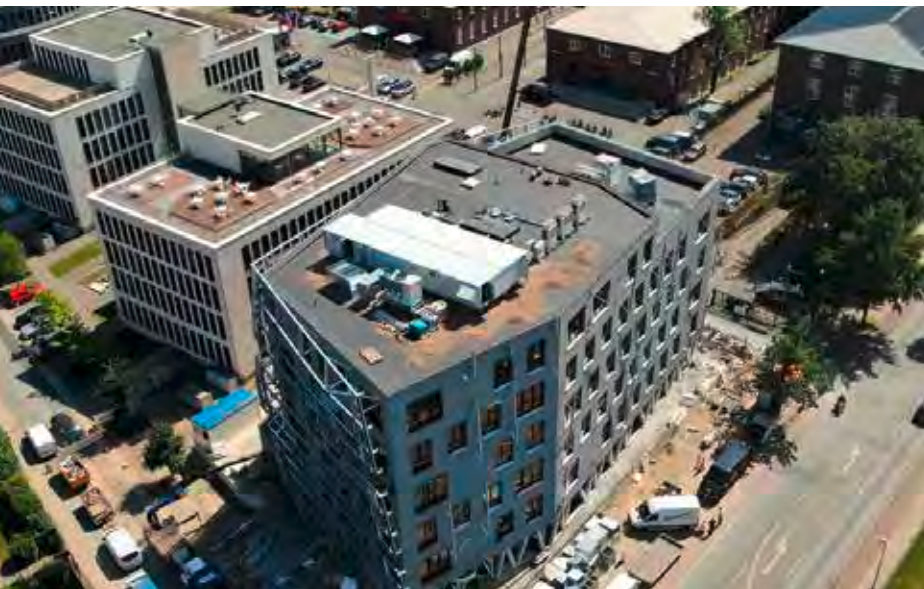
Lenkwerk No. 1 im Bau

Bei Fragen wenden Sie sich jederzeit gerne an uns.