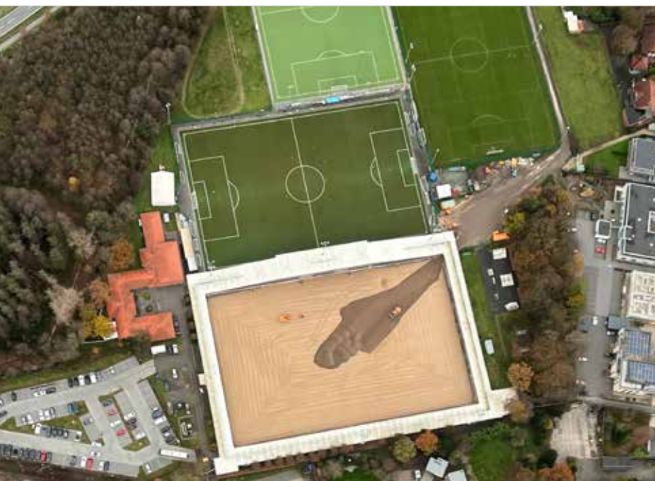
Sportclub Arena in Verl

Bei Fragen wenden Sie sich jederzeit gerne an uns.