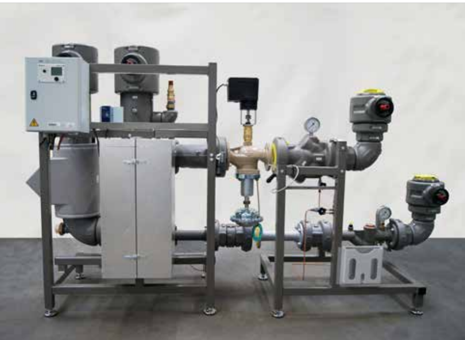
Die ewers Station für die Fernwärmeübergabe