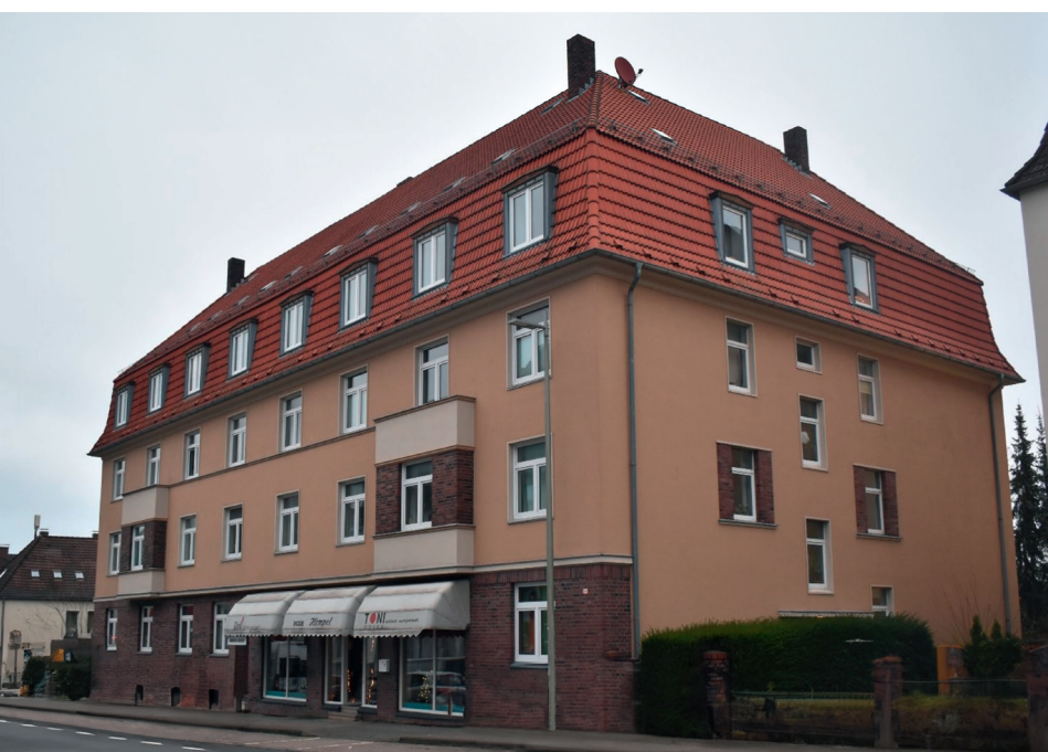
Wohngebäude Bielefeld Jöllenbeckerstraße