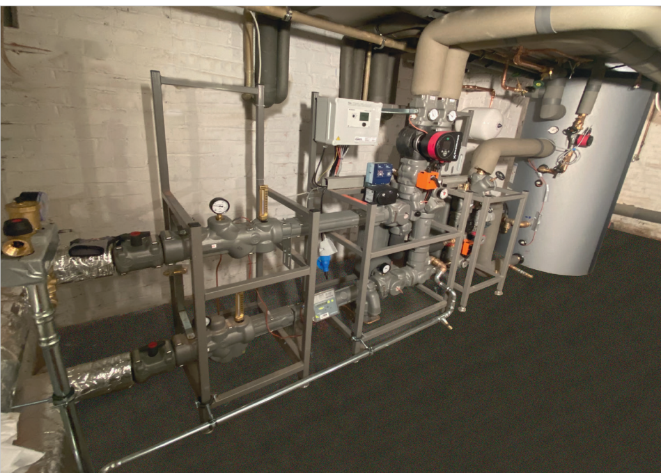
er.1 Rahmenstation für die Fernwärmeübergabe mit et.2 Speicherladesystem