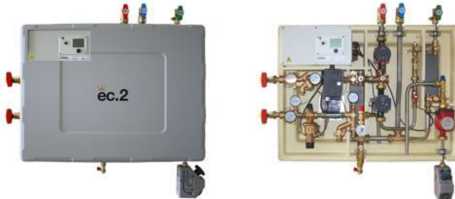
Bild-IDs: ewers_ec_2_modulsystem_kompaktstation_01.jpg, ewers_ec_2_modulsystem_kompaktstation_02.jpg

Bildunterschrift: Die Version ec.2 verfügt über eine etwas aufwändigere Technik, die geringere Rücklauftemperaturen aufgrund einer effizienten Aufheizung des Wassers außerhalb eines Schichtenspeichers erzielt.