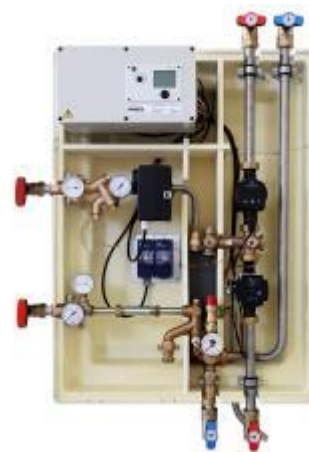
Bild-IDs: ewers_ec_1_modulsystem_kompaktstation_01.jpg, ewers_ec_1_modulsystem_kompaktstation_02.jpg

Bildunterschrift: Die Version ec.1 ist besonders einfach sowie robust aufgebaut und erhitzt das Trinkwasser innerhalb eines Speichers, was ein niedriges Preisniveau ermöglicht.