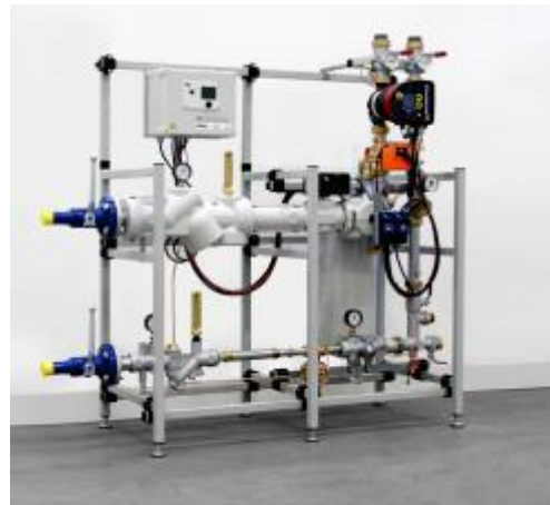
Bild-IDs: ewers_er_modulsystem_rahmenstation_01.jpg, ewers_er_modulsystem_rahmenstation_02.jpg

Bildunterschrift: Wer eine höhere Leistung benötigt, z.B. für Wohn- oder Bürokomplexe, kann alternativ auf die er-Rahmenstationen mit et-Trinkwassererwärmung zurückgreifen.