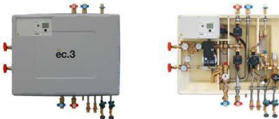
Bild-IDs: ewers_ec_3_modulsystem_kompaktstation_01.jpg, ewers_ec_3_modulsystem_kompaktstation_02.jpg

Bildunterschrift: Die Version ec.3 erfüllt höchste hygienische Ansprüche bei den niedrigsten Rücklauftemperaturen, da sie Warmwasser nur im Bedarfsfall erzeugt und nicht speichert.